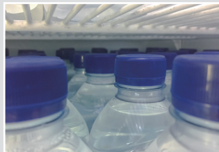
化学品の品質劣化