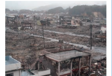
津波の災害 (東日本大震災2011年)