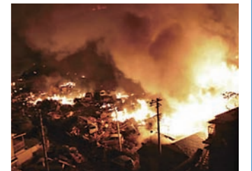
地震による火災 (東日本大震災2011年)