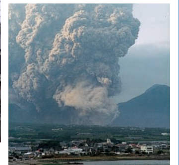
噴火の災害 (有珠山噴火2000年)