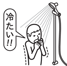
シャワーのお湯が出ない

このサービスは、部品交換や特殊作業を必要としない【トラブルへの応急処置※】を行うサービスです。