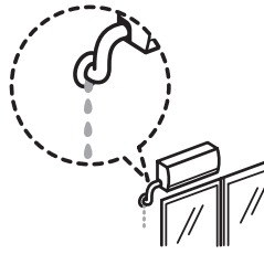
エアコンの水漏れ