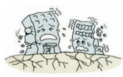
②地震で建物が倒壊した