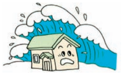
③津波により建物が流された

火災保険では、 ①地震等による火災(およびその延焼・拡大損害)によって生じた損害 ②火災(発生原因の如何を問いません)が地震等によって延焼・拡大したことにより生じた損害 はいずれも補償の対象となりません。 これらの損害を補償するためには、地震保険が必要です。