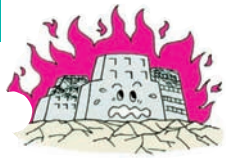
①地震で火災がおこり建物が焼けた