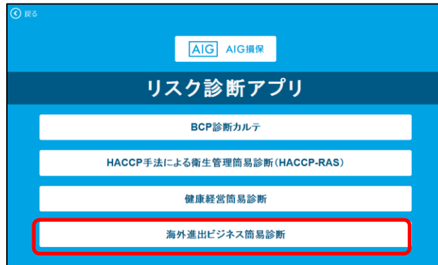
AIG損保リスク診断アプリ