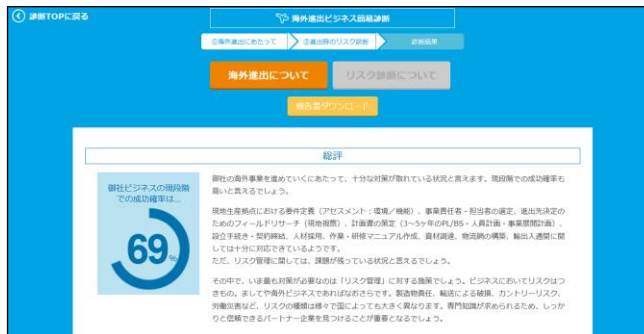
その場で簡易診断結果が分かると共に、後日詳細レポートをお届け