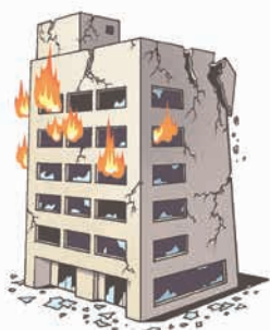
地震で火災が発生し、建物等が焼失した