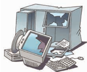
什器(じゅうき)・備品