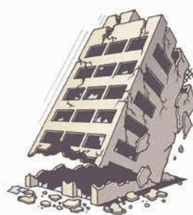
地震で建物が倒壊、損傷を受けた