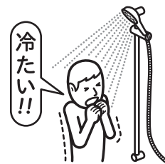
シャワーのお湯が出ない

このサービスは、部品交換や特殊作業を必要としない【トラブルへの応急処置※】を行うサービスです。