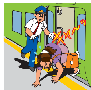
交通乗用具の乗降場構内(改札内)にいる間の事故