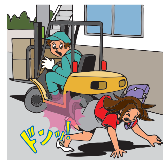
道路通行中に、作業中のクレーン車やフォークリフトなどの衝突・接触などの事故