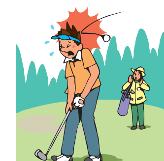
スポーツ中のケガ