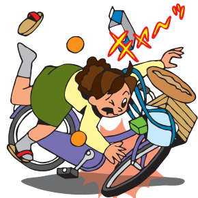
運行中の交通乗用具に乗っている間の事故