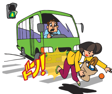
運行中の交通乗用具との衝突・接触などの交通事故

補償の対象となる方が、次の事故に遭いケガ(骨折、やけどなど)をした場合に、補償の対象となります。