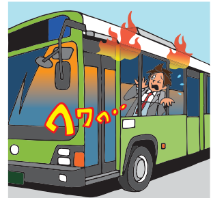
交通乗用具の火災