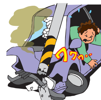
交通事故によるケガ